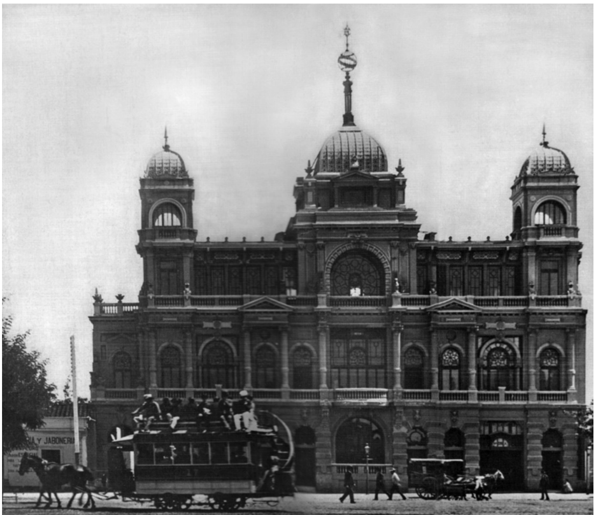
Figura 7. Fachada palacio Elguín, Alameda esquina Brasil. Facade of the Elguín Palace, at the intersection of Alameda and Brasil Avenues.

Si este caso en particular no hubiese sido indagado desde el punto de vista histórico-artístico, todavía