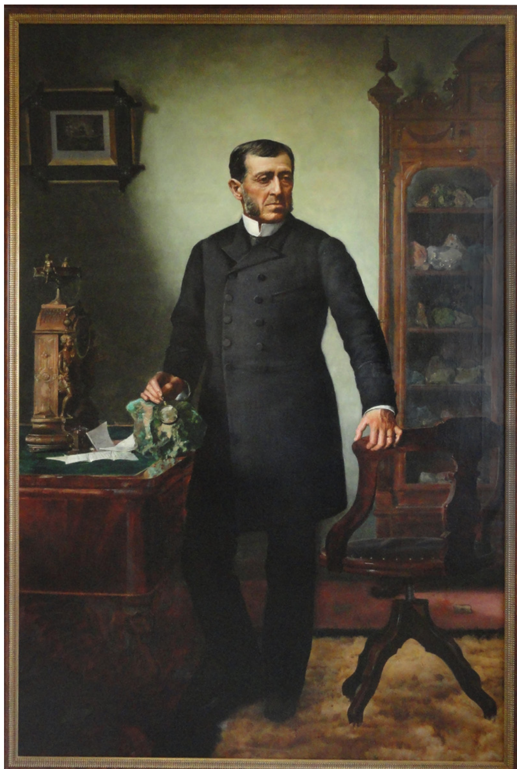
Figura 1. Retrato de Nazario Elguín por Cosme San Martín, 1889. Óleo sobre tela; 216,5 x 142 cm. Portrait of Nazario Elguín by Cosme San Martín, 1889. Oil on canvas; 216,5 x 142 cm.