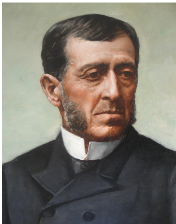
Figura 3. Superior. José Santos Ossa (Ilustración: anónima; reproducción: Archivo fotográfico Museo Histórico Nacional, N° Inventario Fa-9063).

Upper. José Santos Ossa (Illustration: anonymous; reproduction: Photographic Archive of the National History Museum, Inventory no. Fa-9063).