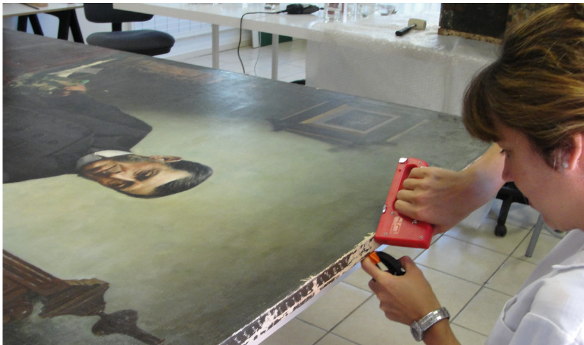
Figura 6. Tratamientos de conservación-restauración. Montaje de la obra en su nuevo bastidor. Conservation-restoration work. Mounting the painting on its new stretcher frame.

En ese sentido se dio prioridad a los tratamientos de conservación, es decir, a aquellos procedimientos enfocados a detener los deterioros activos en la obra, derivados principalmente del problema de distensión del soporte que conlleva a poner en riesgo la integridad de la capa pictórica (Figura 6).